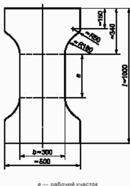
Рисунок 2 — Форма и размеры испытываемого образца