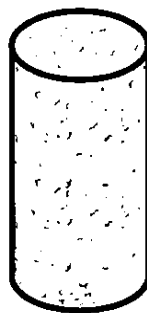
Рисунок 2 — Агломерированная корковая пробка

4.1.2 Агломерированные корковые пробки — это пробки, корпус которых целиком состоит из агломерата (рисунок 2). Пробки этого типа не следует использовать для игристых вин.