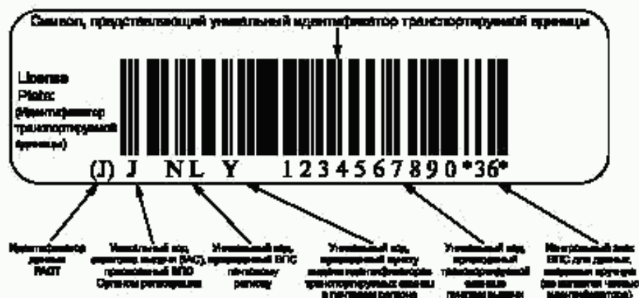
Рисунок В.2 — Пример представления уникальной идентификации транспортируемых единиц в символике штрихового кода Code 128 (Код 128)

В.2 Пример представления уникальной идентификации транспортируемых единиц в символике штрихового кода Code 128 (Код 128)** с идентификатором данных FACT (ФАКТ)*** «J» и визуальным представлением приведен на рисунке В.2.