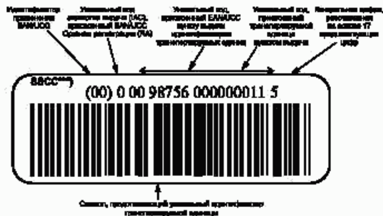
Рисунок В.1 — Пример представления уникальной идентификации транспортируемых единиц в символическом штриховом коде EAN/UCC 128 с идентификатором применения EAN/UCC «00» и визуальным представлением

В.1 Пример представления уникальной идентификации транспортируемых единиц в символическом штриховом коде EAN/UCC 128* с идентификатором применения EAN/UCC** «00» и визуальным представлением приведен на рисунке В.1.