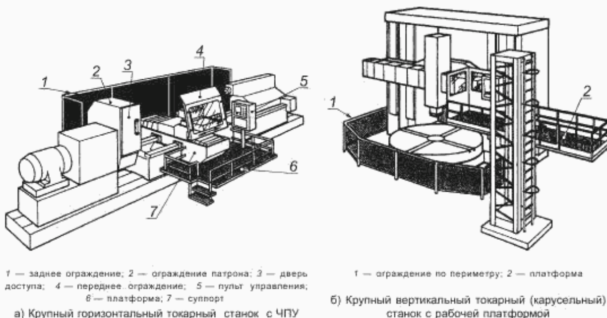
Рисунок 1 — Примеры крупных токарных станков

3.1 токарный станок с числовым программным управлением (numerically controlled turning machine): Станок, у которого главное движение — это вращение обрабатываемой детали относительно режущего инструмента. Станок управляется ЧПУ, на станке возможен автоматический режим работы по 3.3.1 (см. рисунок 1).