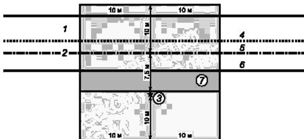
а) Зона, свободная от отражающих или экранирующих барьеров безопасности или дорожных ограждений