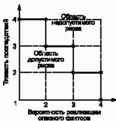
Рисунок Б.1 — Диаграмма анализа рисков

Если точка лежит на или выше границы — фактор учитывают, если ниже — не учитывают.