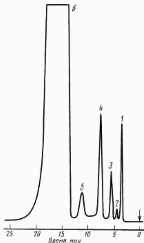
Типовая хроматограмма изоамилового спирта

1 — изопропанол; 2 — изовалериановый альдегид; 3 — вторичный бутанол («внутренний эталон»); 4 — изобутанол; 5 — нормальный бутанол; 6 — изоамиловый спирт