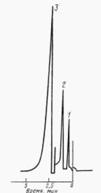
Типовая хроматограмма ацетона при определении массовой доли воды