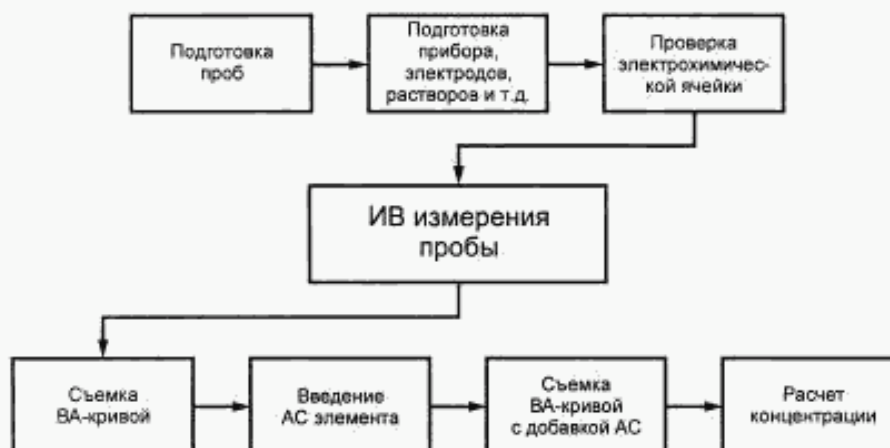
Рисунок 1 — Основные этапы анализа проб методом ИВ

ИБ метод анализа проб безалкогольных напитков, питьевых и минеральных вод на содержание селена основан на проведении измерений раствора пробы после ее предварительной подготовки. Общая схема анализа представлена на рисунке 1.